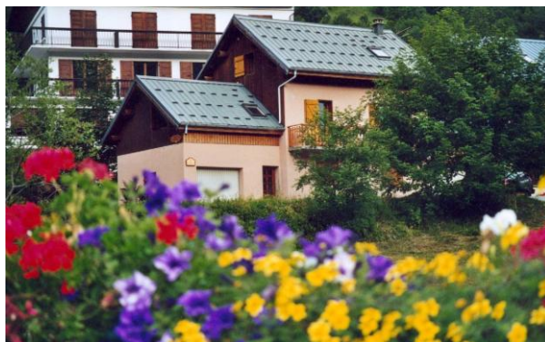
Chalet "L'Andorse" à la Borgé