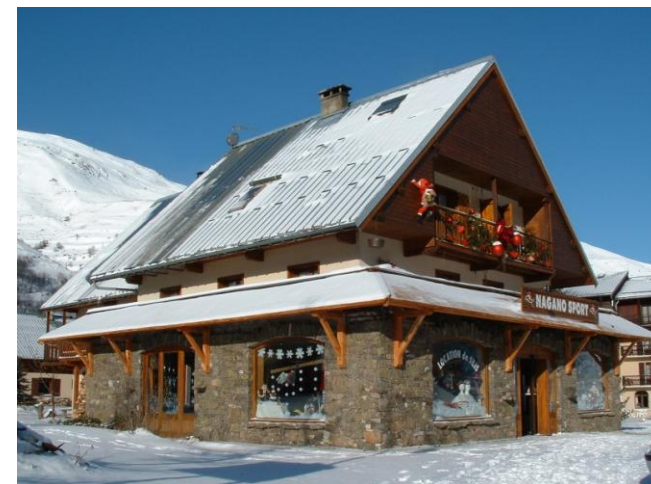
Chalet "Le Barillon" - Nagano Sport

Tél. : 04 79 59 50 11 Mail : amrapin@club-internet.fr