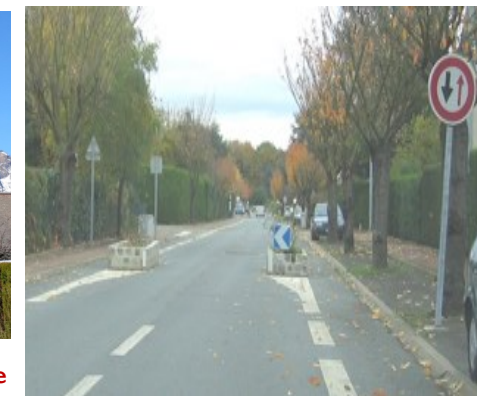
Systèmes de ralentisseur