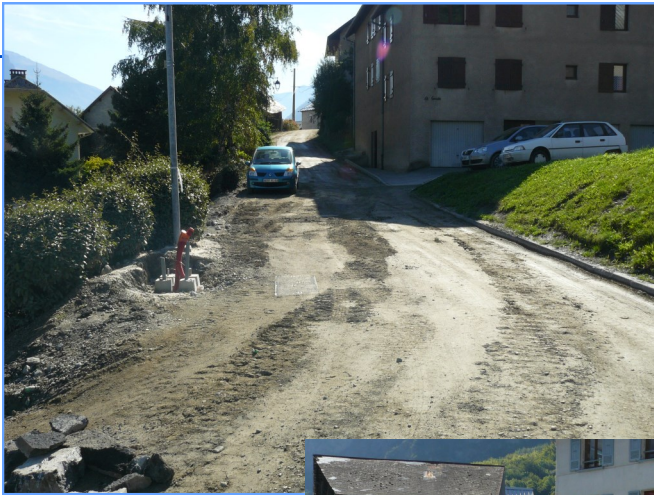
Pendant les travaux

Le 15 octobre dernier a eu lieu la réception des travaux des rues le Bourneau, Philomène Durieux et la Garde, marquant la fin de la troisième tranche des travaux de réfection des réseaux du Chef-Lieu.